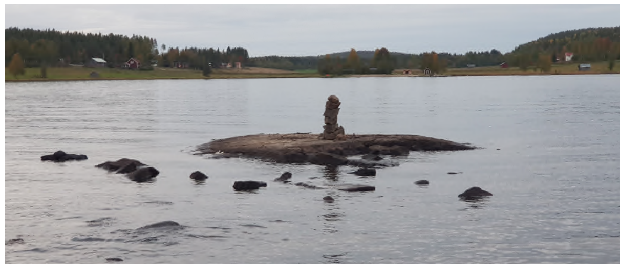
Bild: Metarhällan Degersjö 2018-09-18