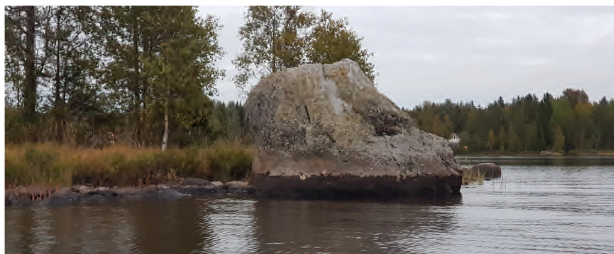
Bild: Storsten Bjännsjö 2018-09-18