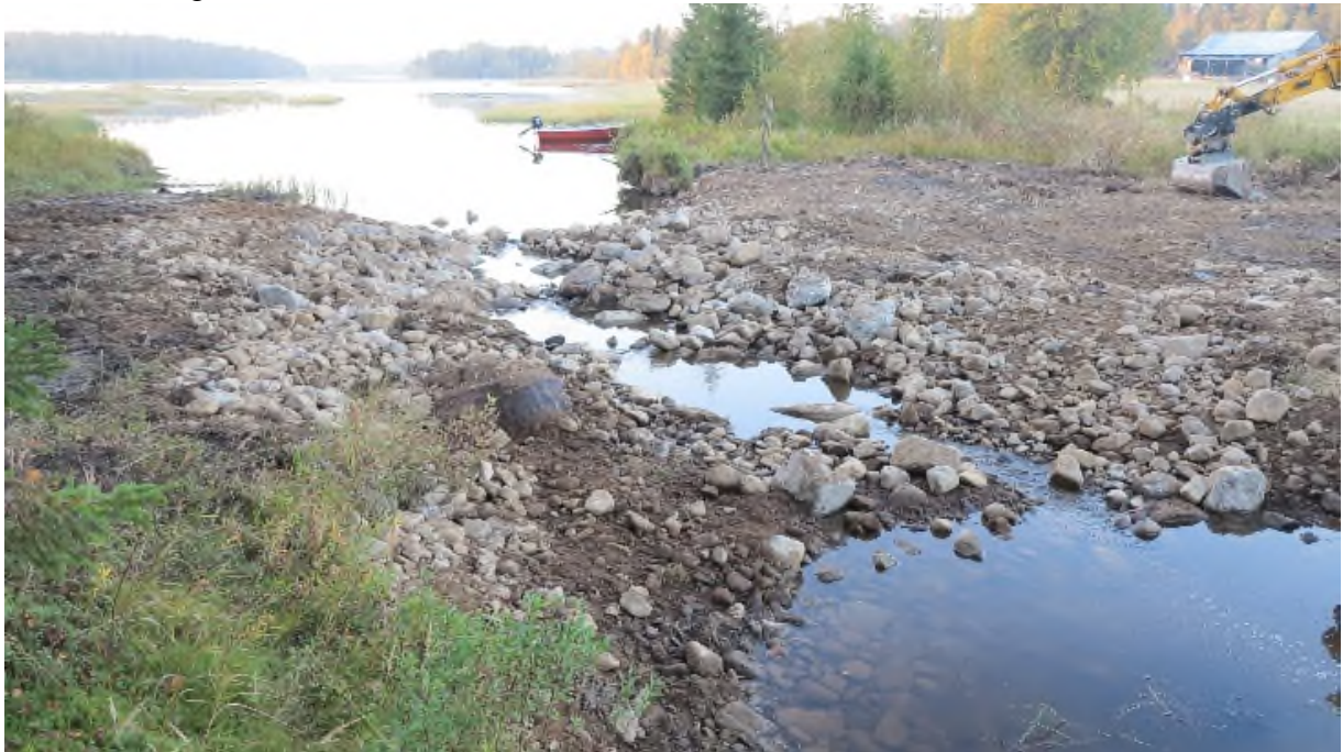
Bild: Efter åtgärd 2014-09-13