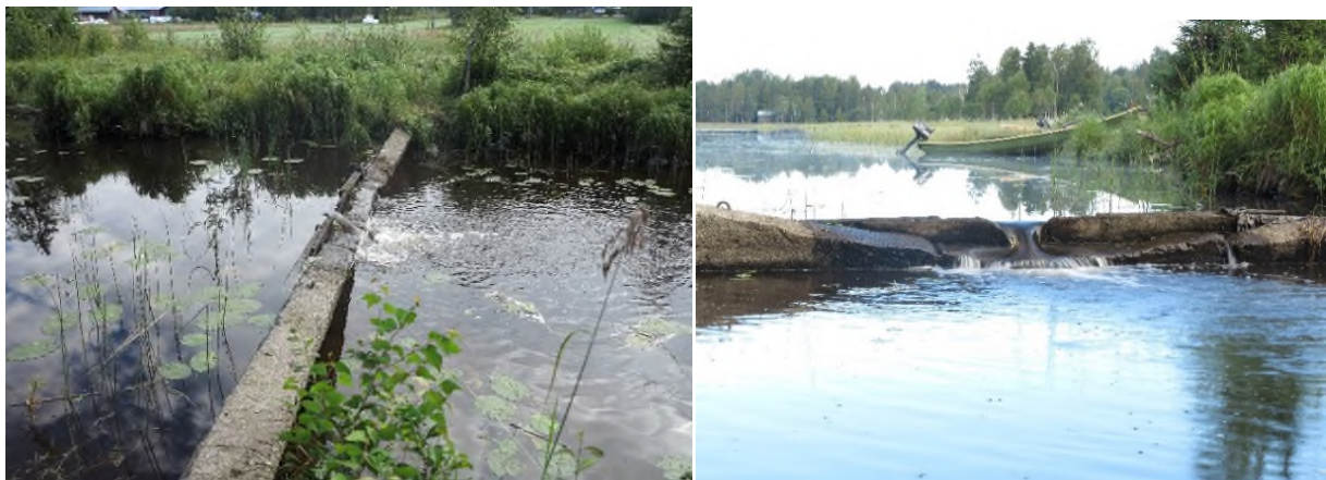
Bild: Tidigare betongtröskel

I början av 80-talet fördes diskussioner, bl.a. inom Bjensjöns fiskevårdsområde hur man skulle kunna uppnå en jämnare vattennivå i Bjännsjön och motverka att den steg kraftigt under vår och höst. Efter muntliga kontakter med Vattendomstolen beslutades på fiskevårdsområdets årsstämma 1986, att en urgrävning av sjöns utlopp skulle genomföras. För att säkerställa att sjöns lägsta vattennivå bibehölls anlades en betongtröskel i sjöns utlopp. 2004 genomförde Länsstyrelsen en inventering ( Biotopvårdsplan 2004 Norrmjöleån ) av Norrmjöleåns vattensystem där det berörda vattendraget ingår. I rapporten framgår att man anser att betongtröskel utgör ett partiellt vandringshinder och bör åtgärdas. 2013 tas ett beslut på fiskevårdsområdets årsstämma att ersätta betongtröskeln med en vandringsbar naturstenströskel med oförändrad tröskelnivå. För att få utföra åtgärden lämnas en anmälan in till Länsstyrelsen och 2014 genomförs arbete. Året efter finns det delade meningar huruvida sjöns vattennivå påverkats av den utförda åtgärden. Detta leder senare till att åtgärden anmäls och slutligen till att Miljödombstolen ålagt Bjensjöns fiskevårdsområdet att söka tillstånd för den utförda trösklingen.